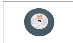
Réf. 9191 Meule Gr46 150 x 25 x 20 mm