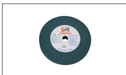
Réf. 9197 Meule Gr60 150 x 25 x 20 mm