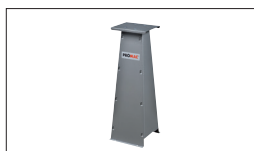
Ref : 9399 Optionaler Stand