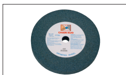
Ref : 9191 Schleifscheibe Körnung 36