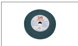
Réf. 9197 Meule Gr60 150 x 25 x 20 mm