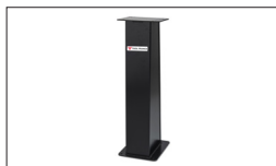
Réf. TF-SG Socle universel 290 x 300 x 830 mm