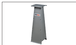
Réf. 9399 Socle universel 290 x 300 x 830 mm