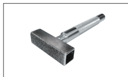
Réf. 2231 Dresse meule diamanté