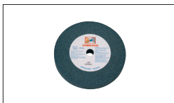
Réf. 9341 Meule Gr46 205 x 25 x 20 mm