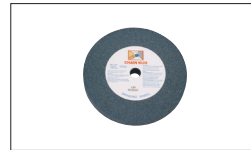
Réf. 9340 Meule Gr46 205 x 25 x 20 mm