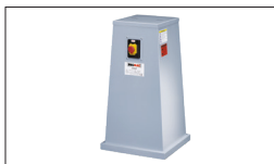
Réf. 300Z Socle motorisé 230V avec arrêt d'urgence et aspi- ration \varnothing 36 et \varnothing 100 mm : 470 x 490 x 870 mm