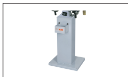
Réf. 2004 Socle robuste 500 x 415 x 800 mm