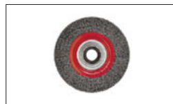
Réf. 10034 Brosse métallique 200 x 20 x 16 mm