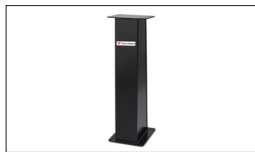
Réf. TF-SG Socle universel 290 x 300 x 830 mm