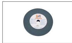
Réf. 9340 Meule Gr46 205 x 25 x 20 mm