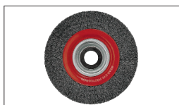
Réf : 10040 Brosse métallique 250mm