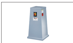
Réf : 300Z Socle avec aspiration