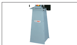
Réf : 9951 Socle