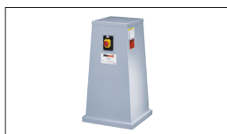
Réf. 300Z Socle motorisé 230V avec arrêt d'urgence et aspi- ration \varnothing 36 et \varnothing 100 mm : 470 x 490 x 870 mm