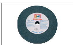
Réf : 9973 Meule Gr 36