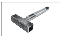
Réf : 2231 Dresse meule diamant