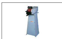
Réf. 9876 Socle en option