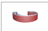
Réf. 9872 Bande abrasive Gr 120