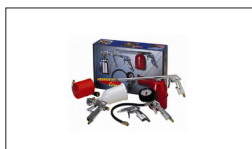
Réf : 2180 Kit 5 pièces