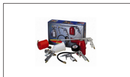
Réf : 2180 Kit 5 pièces