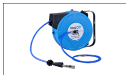
Réf : 98341B Tuyau Dévidoir