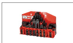
Réf : 50000028 Assortiment cales de serrage T8