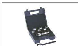
Réf : 50000027 Coffret porte pinces CM2 de 6 pinces (3,4,5,6,8,10)