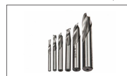
Réf : 50000037 Coffret de 6 fraises HSS queue cylindrique(3-4-5-6-8-10)