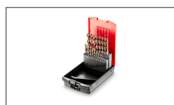
Réf : D19GS Coffret 19 Forêts HSS G rectifiés - de 1 à 10mm par 0,5