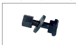
Réf : 2530 Jeu de Coulisseaux T8