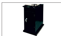
Réf : 50000056-G Socle