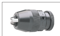
Réf : 50000038 Mandrin porte fraise CM2/Ø13mm 0.5-13mm B16