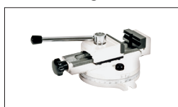
Réf : 50000036 Etau à base pivotante 55 x 75mm