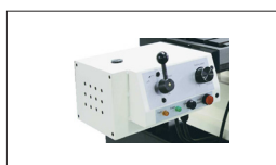
Réf : 50000055-B Dispositif d'entraînement Axe X