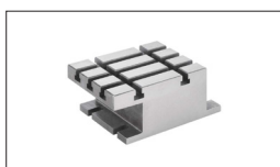
Réf : 50000057 Table de travail à l'horizontale