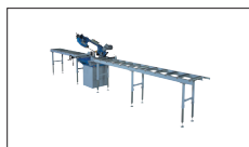
Réf : 2017C