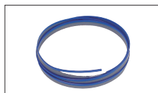
Réf : « Selon Denture »