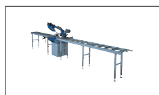
Réf: 2020 Table de sortie