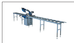
Réf : 2017C / 2020 Table d'amenage