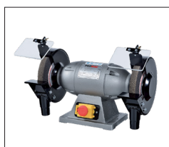
Ref 324E / 325E