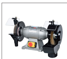
Ref 324F / 325F