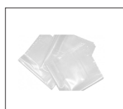
Réf : 709563 Sac de rechange (pack de 5 sacs)