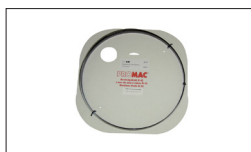
Réf. 2505 Lame de scie 2240 x 10 x 0.65 mm, 6 DTS