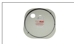
Réf. 2503 Lame de scie 2240 x 3.0 x 0.65 mm, 14 DTS