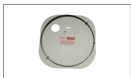
Réf. 2504 Lame de scie 2240 x 6.0 x 0.50 mm, 6 DTS