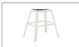
Réf : 10000391 Socle d'appareil JDR-34