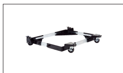
Réf : 708118 Dispositif roulant jusqu'à 250kg