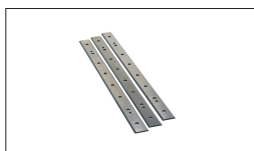
Réf : 10000287 FERS HSS (à l'unité) 260 x 25 x 3 mm