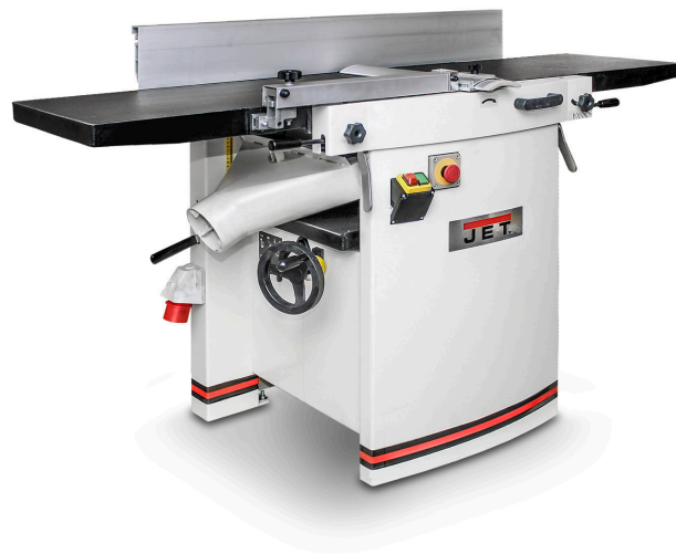
Table de dégauchisseuse usinée en fonte grise garantissant le glissement optimal des pièces à usiner

Changement ultra rapide de dégauchisseuse en raboteuse par le rabattement des 2 volets de la table