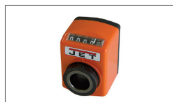
Réf : 10000291 Affichage numérique de rabotage