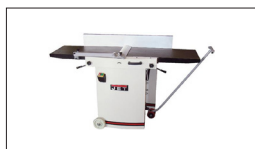
Réf : 10000296 Kit roulettes avec timon