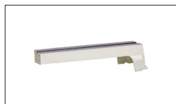
Réf. 719201 Rallonge du banc de machine, 560 mm