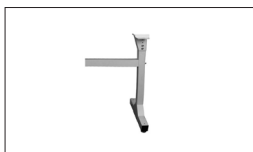
Réf. 719203A Rallonge de socle