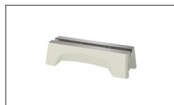
Réf. 719401 Rallonge du banc de machine, 500 mm