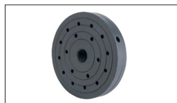
Réf. 709921 Mandrin de fixation, ø 152 mm, logement M33 x 3.5 mm