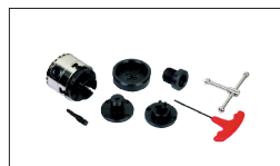
Réf. 10000610 Mini mandrin 1" x 8 TPI