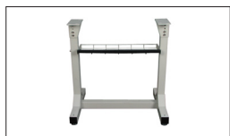
Réf. 719202A Socle