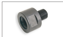
Réf. 709960 Adaptateur M33F x 3.5 mm /1" x 8TPI