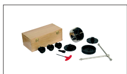
Réf. 10000612 Mini mandrin M33 x 3.5 ø 115 mm