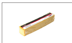
Réf 60-0505 Bâton de nettoyage