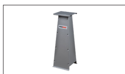
Réf : 9399 Socle