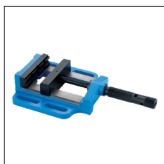
Réf. 9098 Etau manuel 130 mm