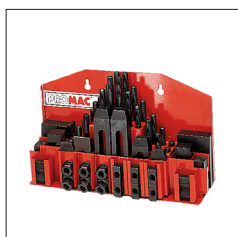
Réf. 9728 Assortiment cales de serrage T14