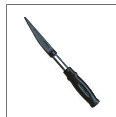
Réf. 2086 Chasse cône