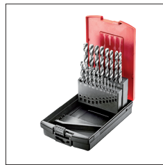
Réf. D-19GS Coffret 19 forêts HSS Co de 1 à 10 mm par 0.5