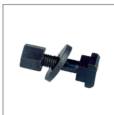
Réf. 9336 Jeu de coulisseaux T14