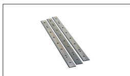
Réf : 10000287 FERS HSS (à l'unité) 260 x 25 x 3 mm