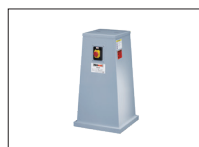
Réf. 300Z Socle avec aspiration