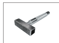
Réf. 2231 Dresse meule