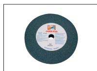
Réf. 9340 Disque Gr 36