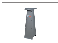
Réf. 9399 Socle