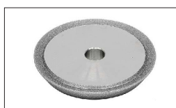
Réf : TFDGO332-162A Meule pour affûtage forets carbure (3-12mm)