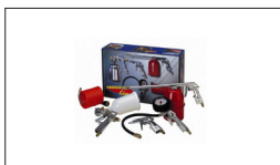
Réf : 2180 Kit 5 pièces