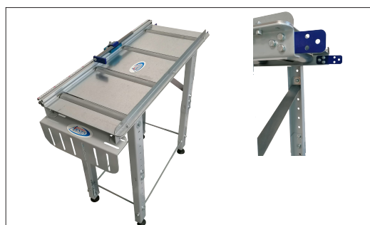
Réf. TFTIM Table entrée ou sortie par 1m