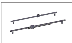
Réf. TFTA-REGLE-2M Règle 2 mètres