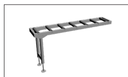
Réf. TFTA-RALLONGE Rallonge